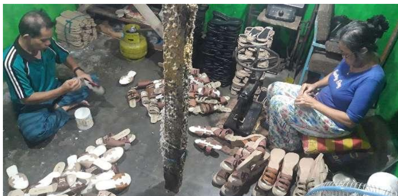
图为周二（31/5），在西瓜哇省打璜（Tasikmalaya）市 Mangkubumi 区的工人正在制造女士凉鞋的情景。

根据印尼鞋工业协会（Aprisindo）数据，鞋业在 2021 年的出口额为 87.4 兆盾，同比增长 28%。政府定下指标，到 2024 年，每年将对皮革和鞋子行业进行 21.7 兆盾的投资。